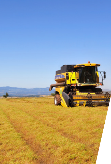
Bassins de production des légumes secs en 2015